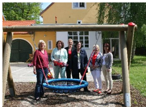
Bei den Döpfer Schulen in Nürnberg