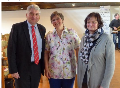
Zu Gast beim OV in Ottensoos