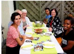
Grillen für Soltani Aug.