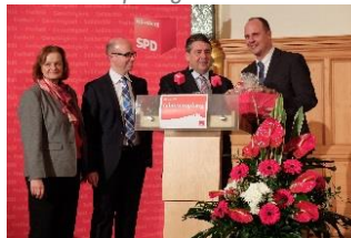
Jahresempfang SPD Feb.