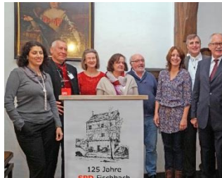
125 Jahre Fischbach Nov.