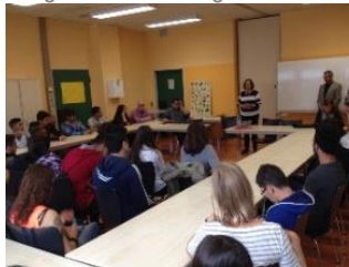
Tag der Ausbildung Juli