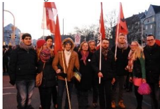
Anti-Nügida Demo Jan.