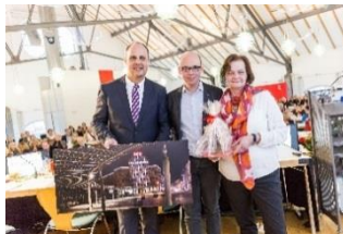
JHV der SPD März